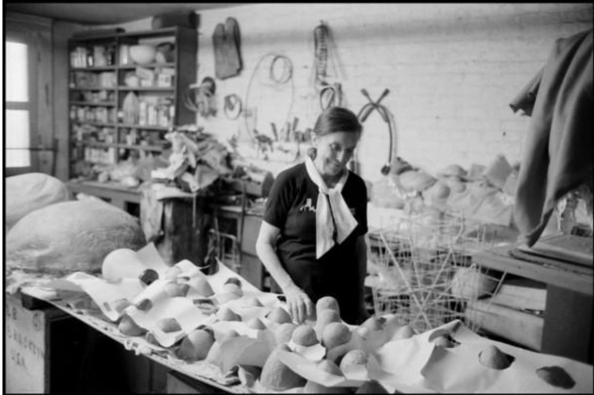
Louise Bourgeois in her studio.

Hieronder volgen enkele voorbeelden om je op weg te helpen. In persoonlijke atelierruimtes worden de muren dikwijls gebruikt om beelden te verzamelen. Aangezien het in een gezamenlijk atelier onmogelijk is voor iedereen een muur te voorzien, komen jullie 'muren' dus in een boek.